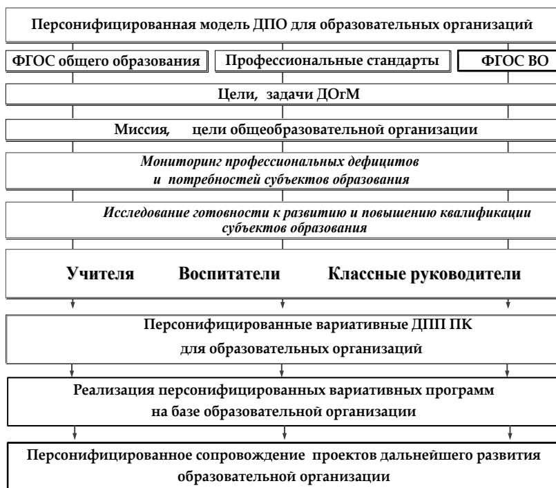
Рис. Модель персонифицированного ДПО для образовательных организаций